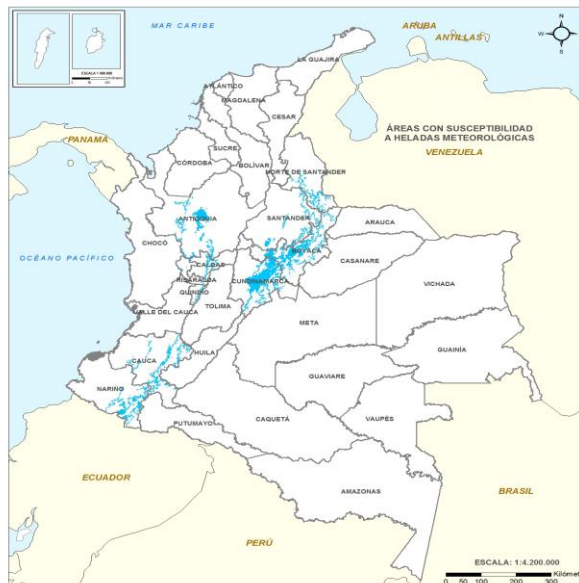
Gráfica 2. Municipios susceptibles a heladas meteorológicas.