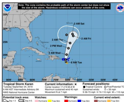
Figura 2. Trayectoria probable del centro de la depresión tropical KAREN, y su intensidad en los próximos cinco días.

De acuerdo con el NHC ( National Hurricane Center ), dicha Tormenta Tropical se desplaza al norte con velocidad de 06 nudos (11 km/h) y actualmente NO representa ningún riesgo de afectación directa sobre el territorio nacional . Se estima que el sistema continúe desplazándose hacia el norte durante los próximos días, saliendo del mar Caribe y adentrándose al occidente del océano Atlántico, sin afectar directamente al área marítima colombiana (figura 2).