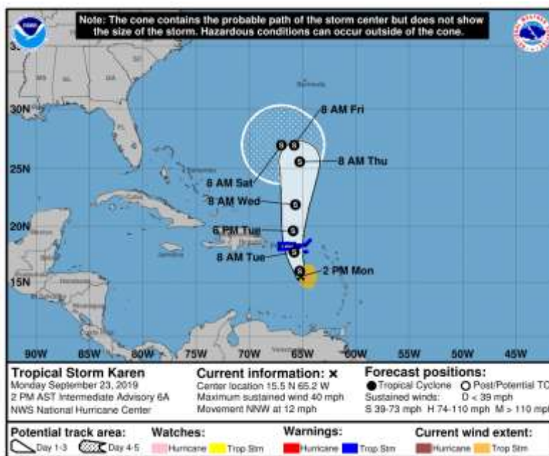
Figura 2. Trayectoria probable de la tormenta tropical KAREN en los próximos días.

De acuerdo con el NHC ( National Hurricane Center ), el sistema ingresó al mar Caribe a las cinco de la mañana de ayer y se prevé que continúe su desplazamiento hacia el norte durante los próximos días, estando cerca del oriente del área marítima nacional, sin embargo, por el momento no representa ningún riesgo de afectación directa al país (figura 2).