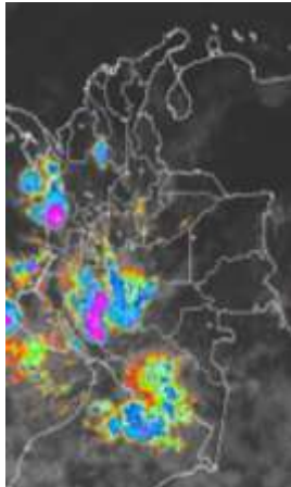
Imagen IDEAM * 24 de enero de 2015 * Hora 7:45 a.m. HLC.