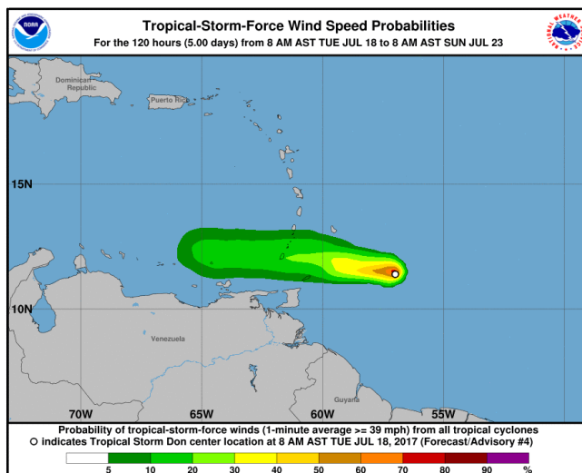
Figura 1. Localización de Don en el Atlántico. Martes 18 de julio hora: 12:30 pm.

Se espera que la tormenta tropical "Don" continúe su trayectoria al oeste (figura 2), perdiendo intensidad al ingresar al mar Caribe oriental durante las primeras horas del día miércoles 19 de julio.