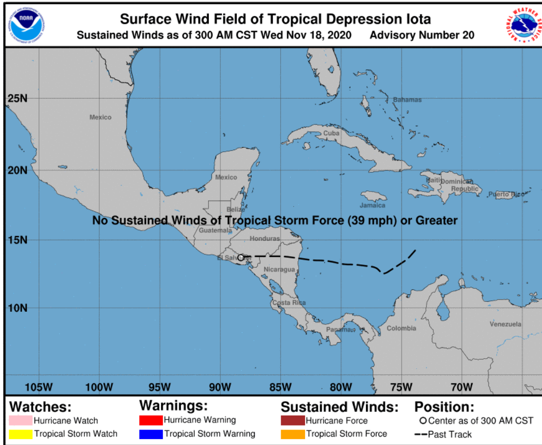
Gráfica 2. Desplazamiento y posición actual de IOTA. National Hurricane Center (NHC-NOAA) 18 de noviembre de 2020. Hora 04:00 HLC.

El Ideam continuará monitoreando las condiciones atmosféricas y marítimas, además recomienda a las entidades del Sistema Nacional para la Gestión del Riesgo de Desastres y al Sistema Nacional Ambiental estar muy atentos de la información que emita el instituto.