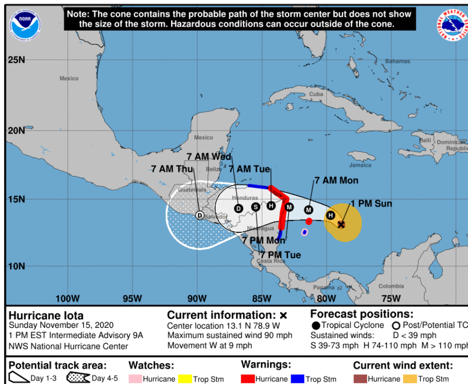
Gráfica 2. Cono de la posible trayectoria del Huracán IOTA para los siguientes días. NHC-National Hurricane Center 15 de noviembre de 2020. Hora 12:40 HLC.

Sugerimos tener especial cuidado en áreas de alta pendiente localizadas en las estribaciones de la Sierra Nevada de Santa Marta, La Guajira y Norte de Cesar y Magdalena. Igualmente, en sectores de los departamentos de Bolívar, Atlántico, Córdoba, Sucre y Golfo de Urabá. También en los departamentos de Antioquia, (Eje Cafetero), Chocó, Norte de Santander, Santander, Boyacá, Cundinamarca, Meta, Occidente de Arauca, Caquetá y Putumayo, ante la probabilidad de crecientes súbitas y/o deslizamientos de tierra.