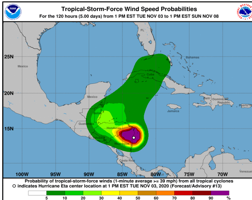
Gráfica 3. Cono de la probabilidad de la fuerza de los vientos del huracán Eta para los siguientes días. NHC-National Hurricane Center 3 de noviembre de 2020. Hora 16:00 HLC.

El Ideam recomienda seguir manteniendo las alertas en el área continental, principalmente en zonas de ladera localizadas en las estribaciones de la sierra nevada de Santa Marta, en sectores del Sur de La Guajira y Norte de Cesar y Magdalena donde son posibles crecientes súbitas y/o deslizamientos de tierra.