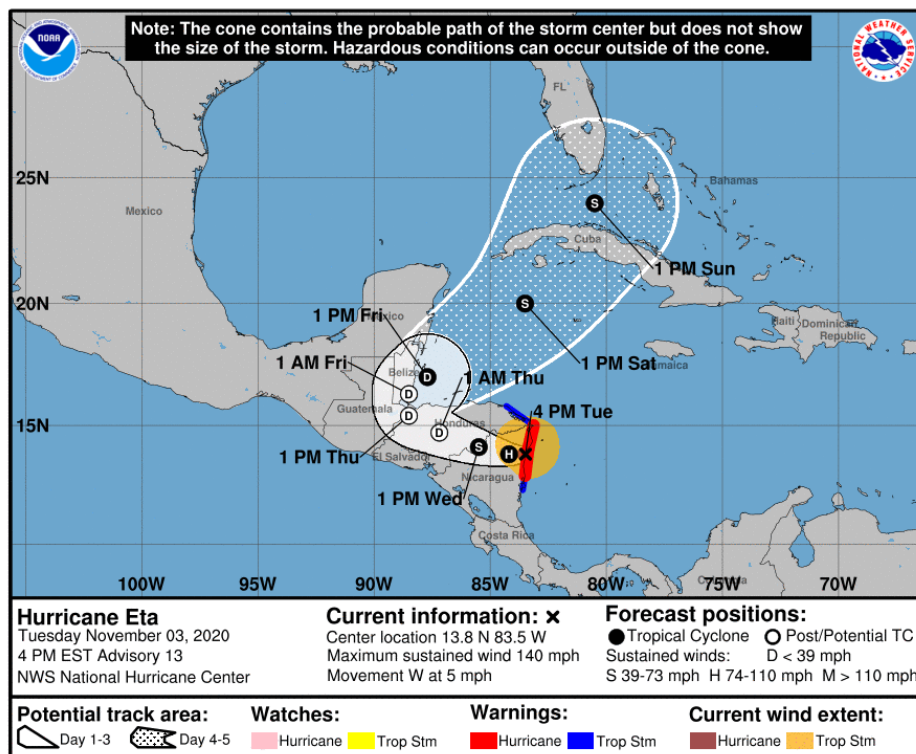
Gráfica 2. Cono de la posible trayectoria del huracán Eta para los siguientes días. NHC-National Hurricane Center 3 de noviembre de 2020. Hora 16:00 HLC.