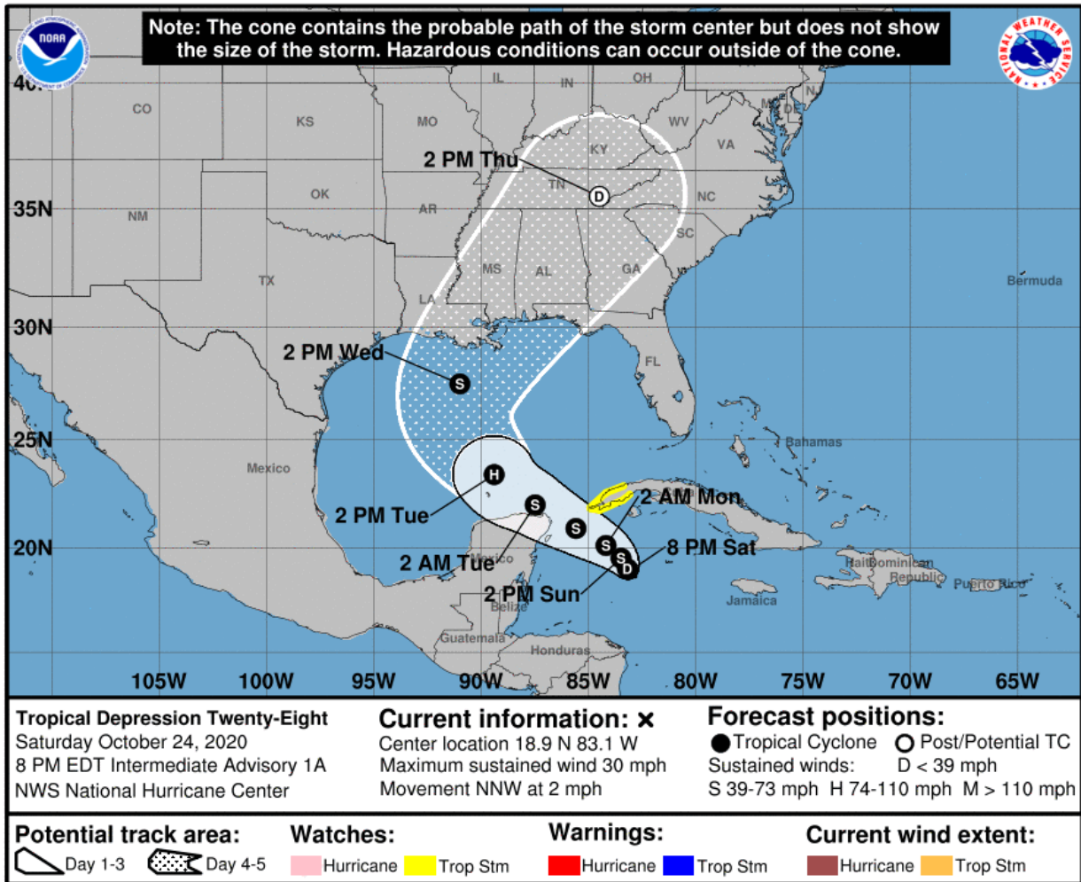
Gráfica 2. Cono de la posible trayectoria de la depresión tropical # 28 para los próximos días. 25 de octubre de 2020. Hora 19:00 HLC.

Aunque el sistema tiende a alejarse del país se prevén condiciones propicias para el desarrollo de nubosidad, precipitaciones, descargas eléctricas y vientos localmente fuertes a causa de las bandas nubosas asociadas al sistema, siendo especialmente importantes en el mar Caribe, incluidos el archipiélago de San Andrés, Providencia y Santa Catalina, sus cayos y el golfo de Urabá, así como en varios sectores de las regiones Caribe y norte de la Andina y Pacífica.